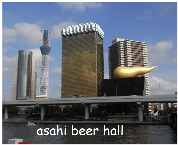
asahi beer hall